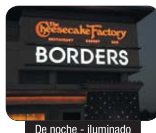
De noche - iluminado

Estos innovadores vinilos le ayudarán a crear luminosos,