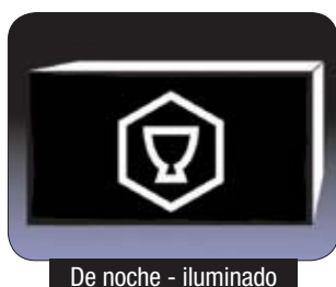
De noche - iluminado